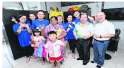
அன்பர் தினத்தில் பெரும்கு சமூக உணர்வு