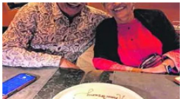
காலம் கடந்தும் சற்றும்குறையாத அன்பு, காதல்